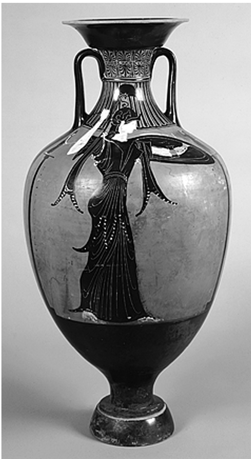
Рис. 2. Тип росписи панафинейской амфоры после изменений 400 г. до н.э.