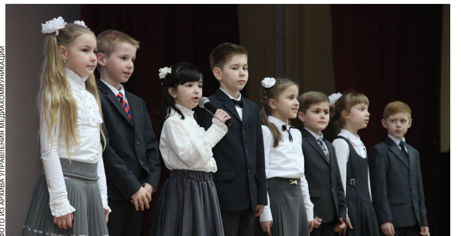
Гимназия № 7