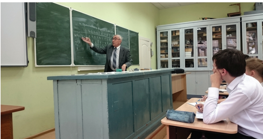
Физико-технический лицей №1